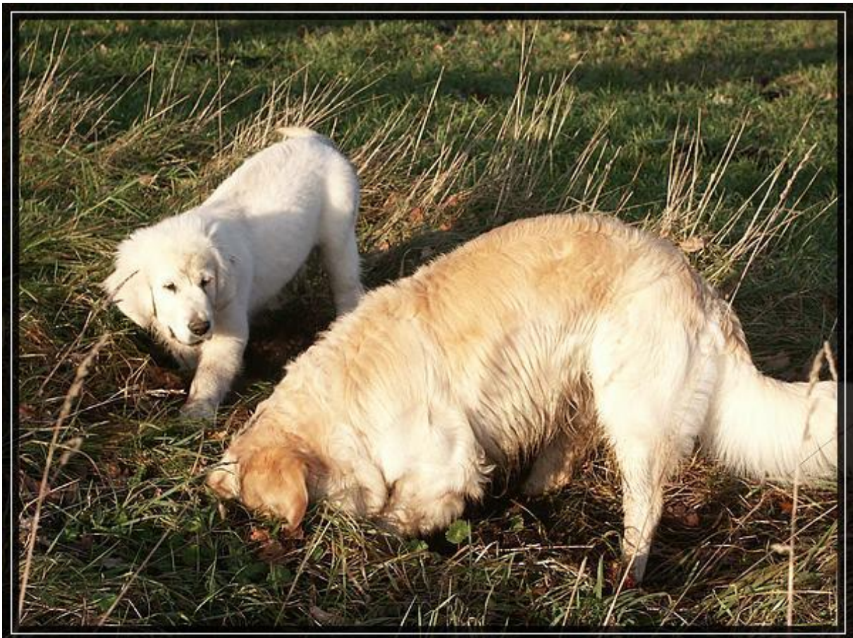
Pablo und Balou bei der Mäusejagd

Das Miteinander zwischen Balou und Pablo gestaltet sich immer ausgeglichener. Es wird zusammen getobt, gebuddelt, gespielt, gerauft, usw.